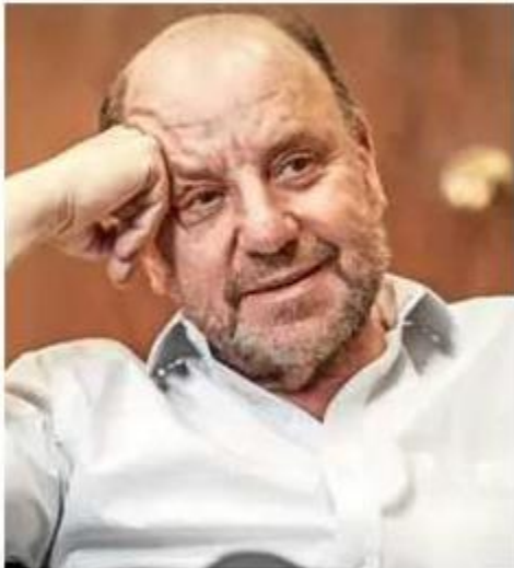
Alfredo Moreno, ministro de Obras Públicas.

Autopista Central determinó seguir el mismo camino que Vespucio Norte y Vespucio Sur, y anoche anunció a la CMF que activó el “mecanismo de solución de controversias” contra el Ministerio de Obras Públicas (MOP), lo que significa escalar la controversia con la cartera y avanzar en un arbitraje ante la respectiva comisión (definida en el contrato de concesión), por el litigio en torno a la manera de contabilizar y aplicar precios en los bloques tarifarios.